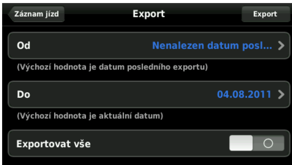
Obrázek 4: Menu exportu

Lze nastavit období, z něž se záznamy vyexportují, nebo volbou Exportovat vše připravit k přenosu celou databázi. Tlačítko Export následně vytvoří v paměti navigace soubor, který lze později načíst pomocí aplikace Dynavix Manager (viz níže).