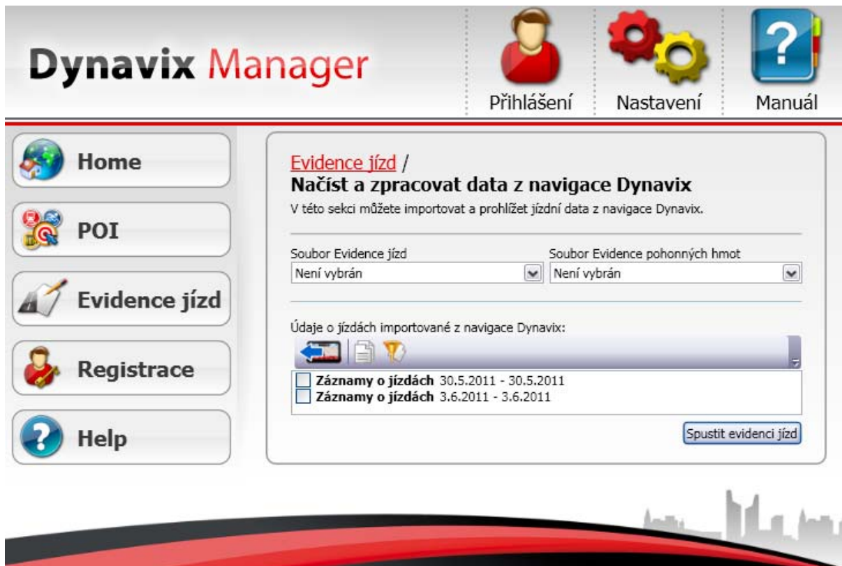
Obrázek 6: Evidence jízd v Dynavix Manageru