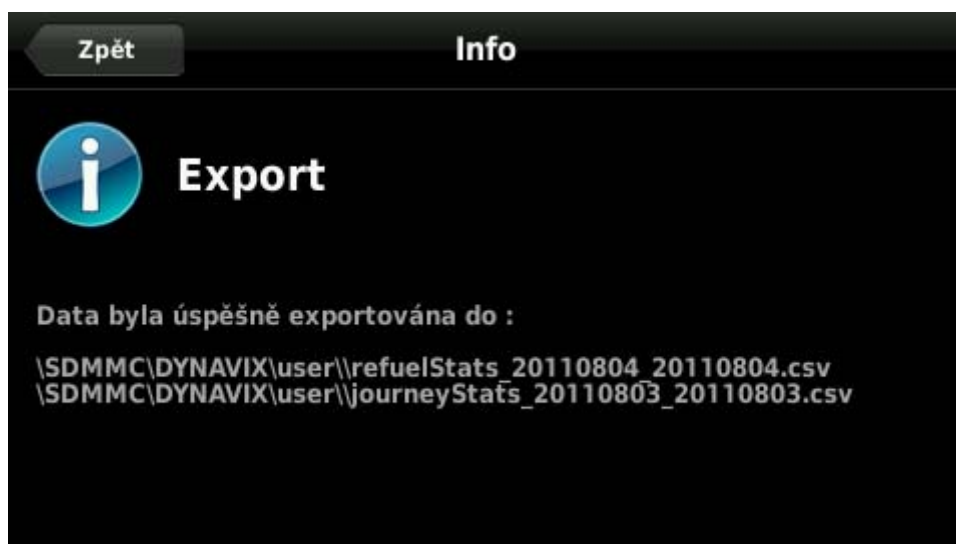
Obrázek 5: Potvrzení o úspěšném exportu dat

Lze nastavit období, z něž se záznamy vyexportují, nebo volbou Exportovat vše připravit k přenosu celou databázi. Tlačítko Export následně vytvoří v paměti navigace soubor, který lze později načíst pomocí aplikace Dynavix Manager (viz níže).