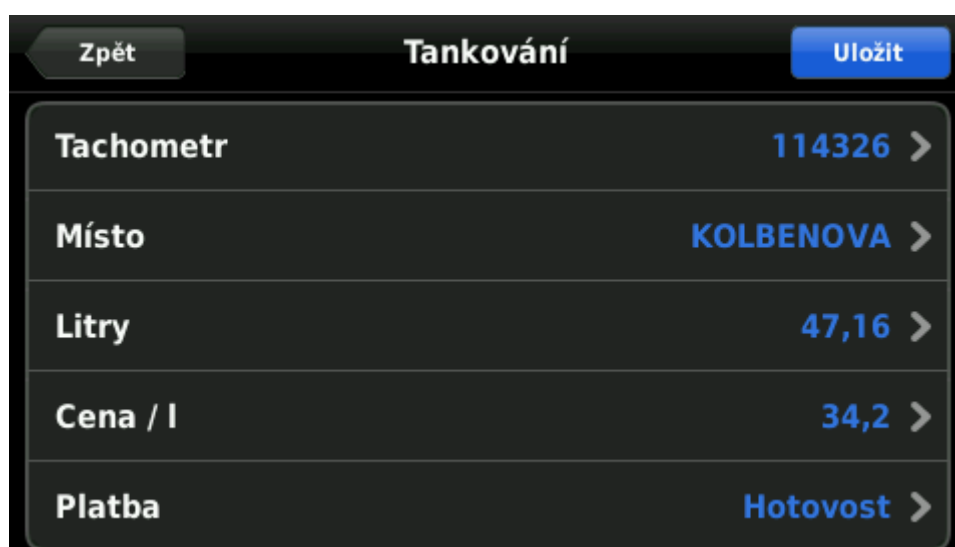
Obrázek 3: Vložení nového tankování

Funkce Tankování umožňuje vést evidenci čerpání pohonných hmot.