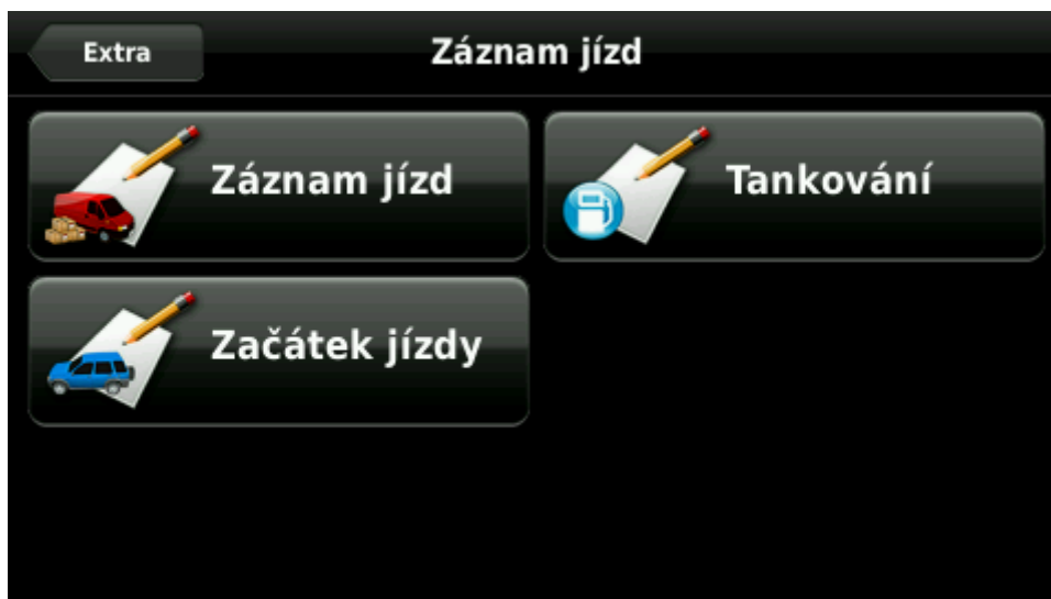
Obrázek 1: Základní menu záznamu jízd

Před použitím je třeba provést počáteční nastavení. Funkci Záznam jízd naleznete v menu Extra. Do nastavení přejdete kliknutím na ikonu Záznam jízd.